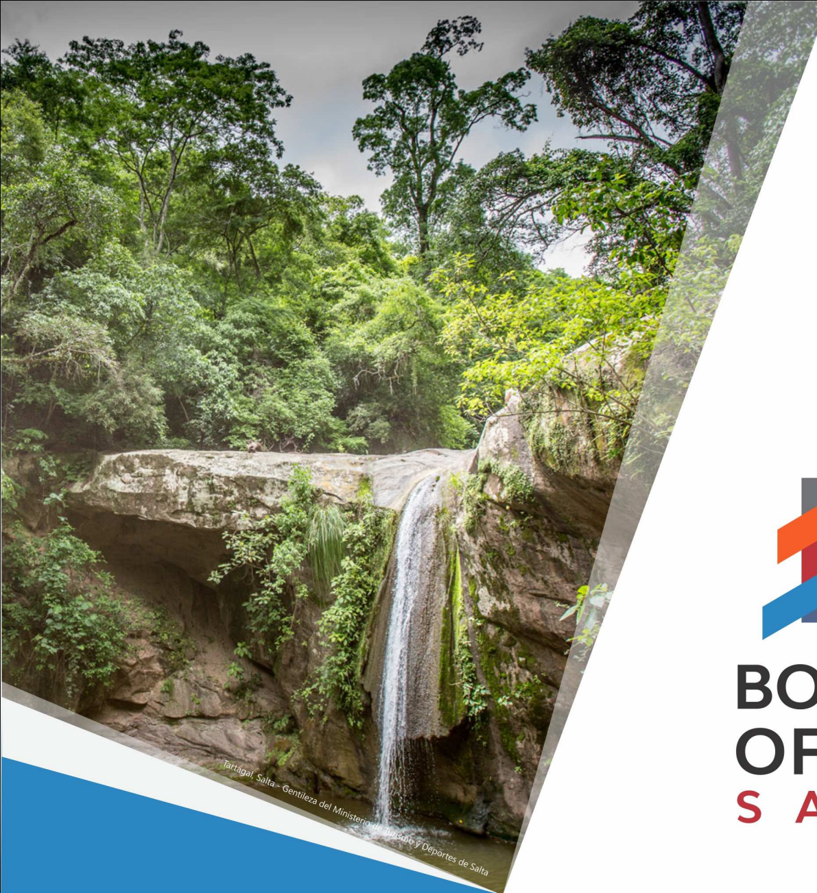
Tartagal, Salta