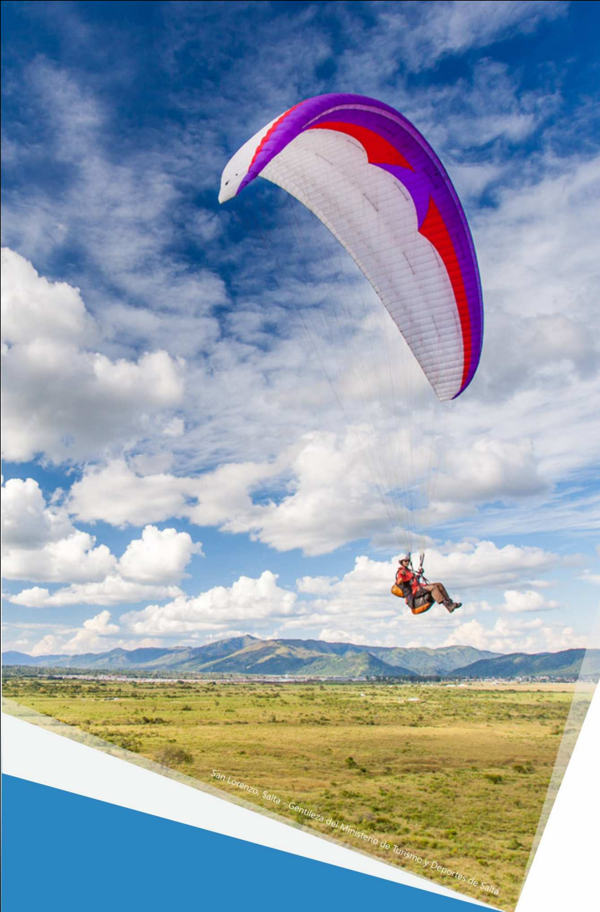
San Lorenzo, Salta