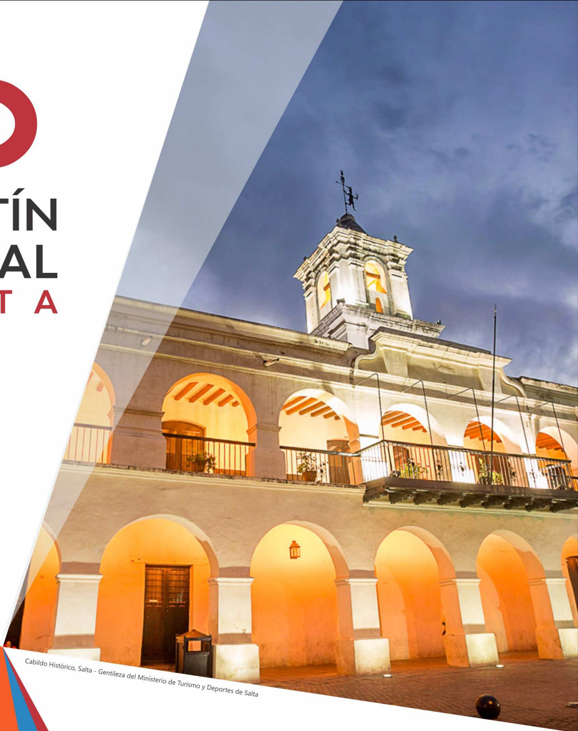
Cabildo Histórico, Salta