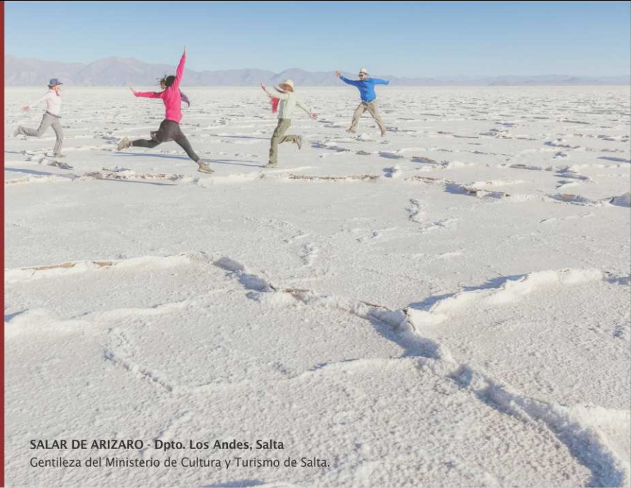
SALAR DE ARIZARO - Dpto. Los Andes, Salta