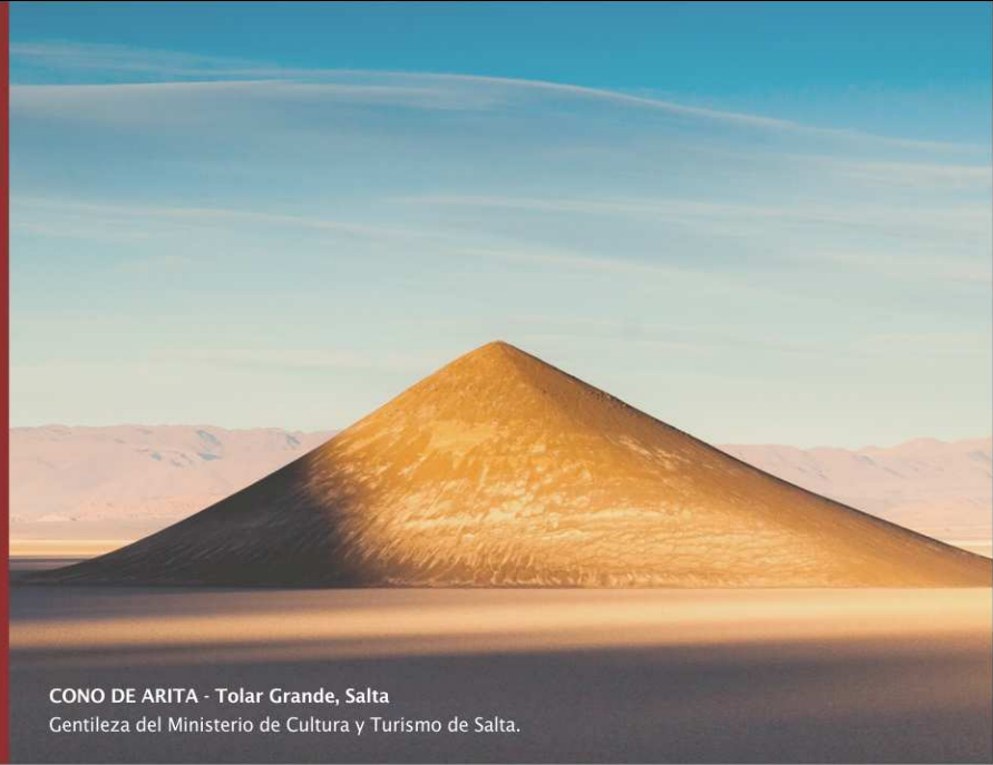
CONO DE ARITA - Tolar Grande, Salta