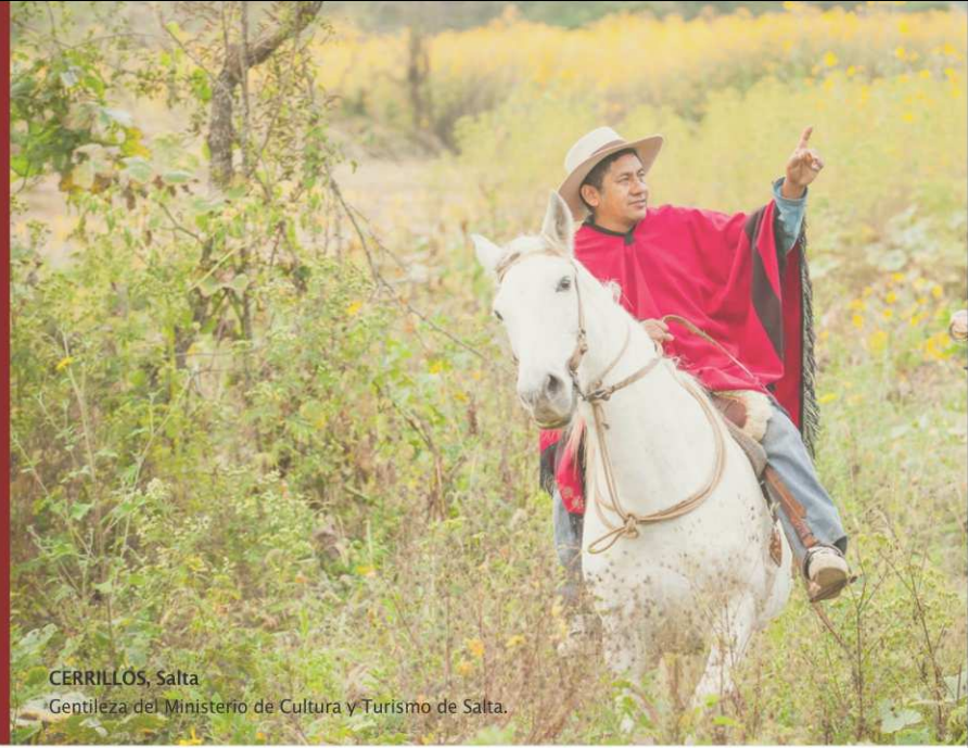
CERRILLOS, Salta