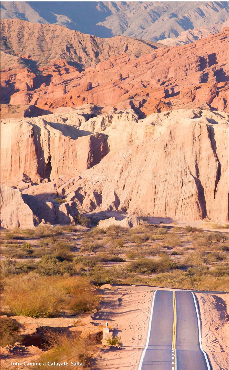
foto: Camino a Cafayate, Salta.