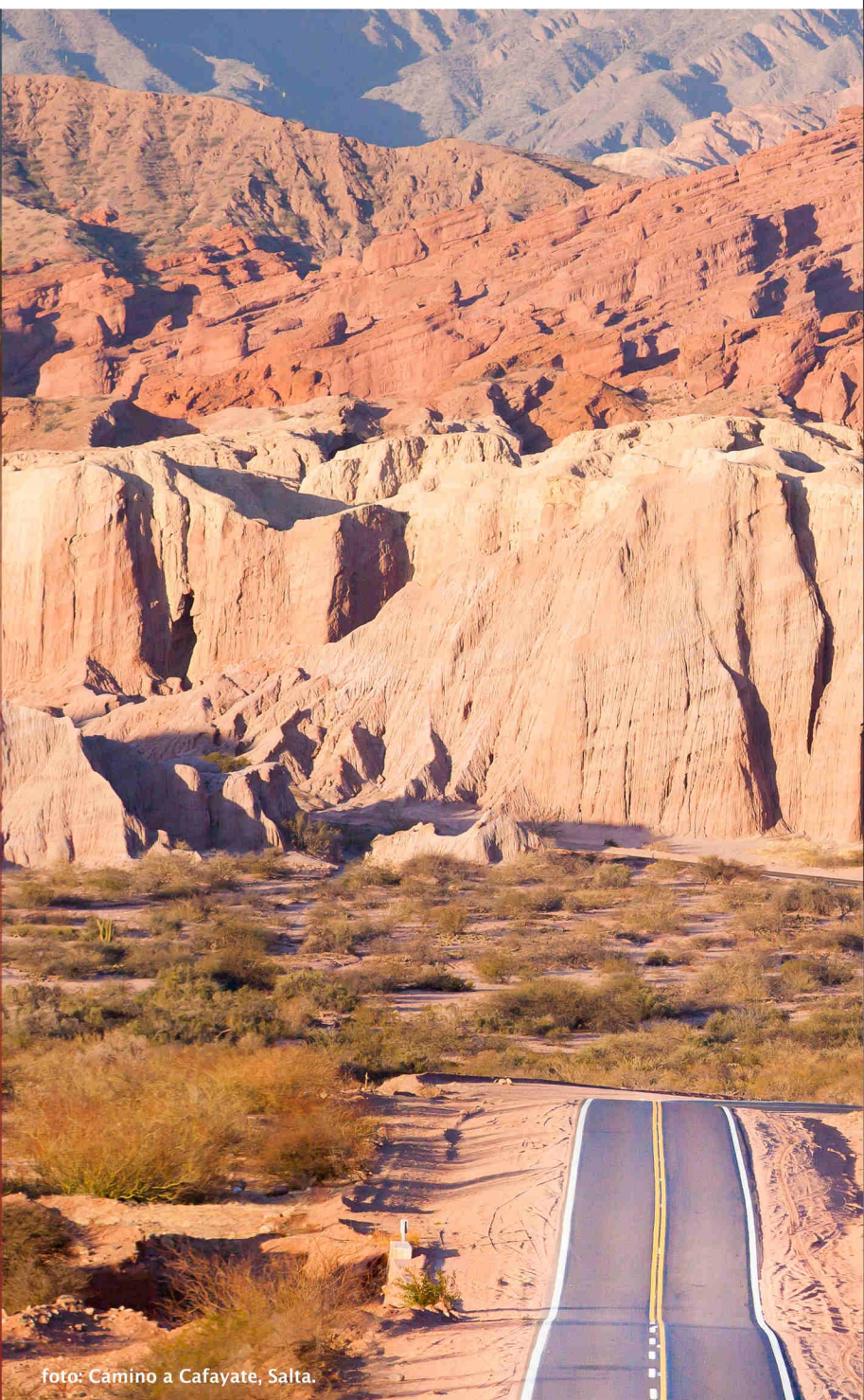
foto: Camino a Cafayate, Salta.